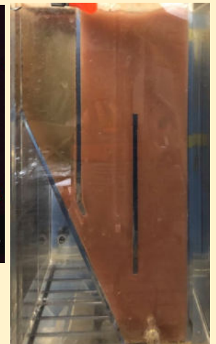
一槽式アナモックス反応槽