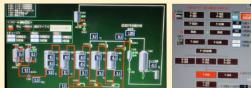
未利用油からの機能性素材製造装置